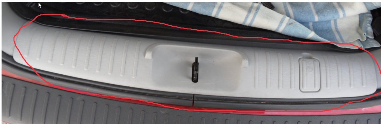
Il suffit de tirer délicatement dessus, elle est juste clipsée